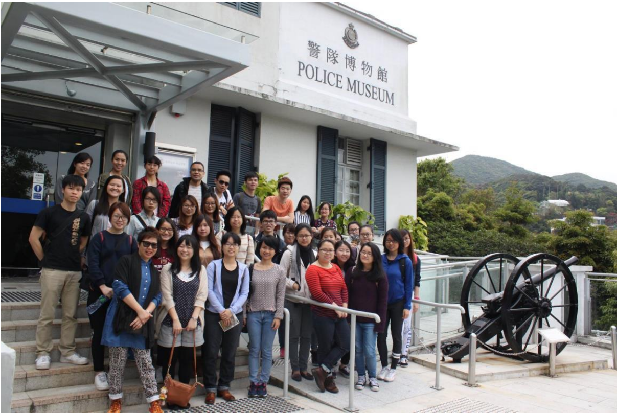
粵語課的戶外教學—「行街廣東話」警隊博物館參觀