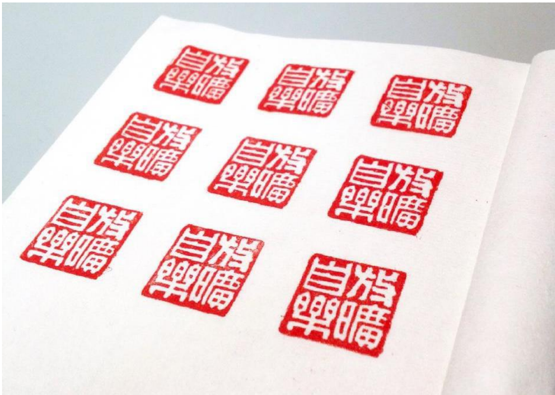
臨摹作品「放曠自樂」