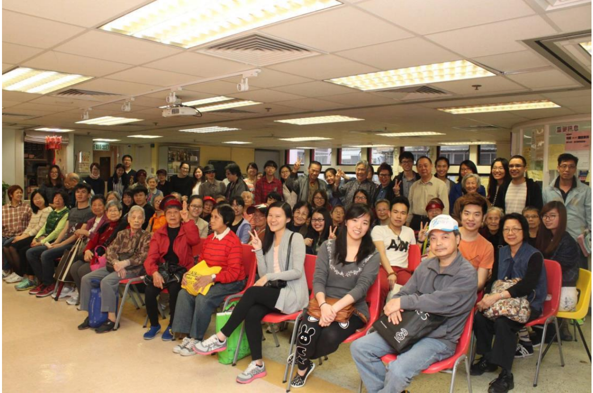
粵語課的戶外教學—「行街廣東話」至社區老人活動中心和家 以粵語聊天