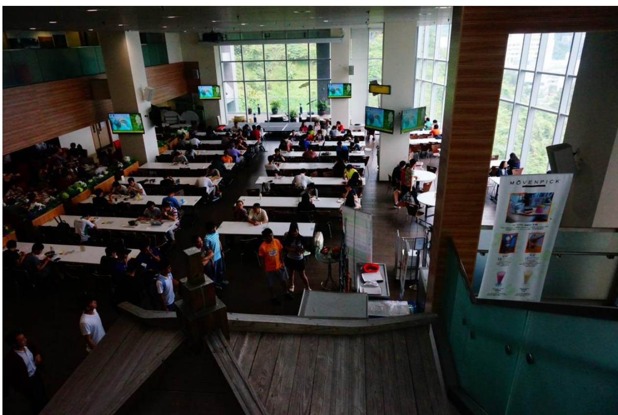
LWS Canteen 和聲書院餐廳