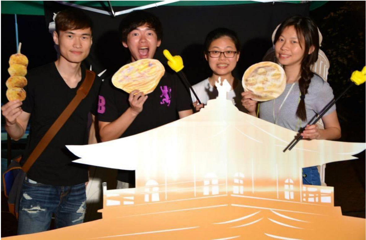
International food festival