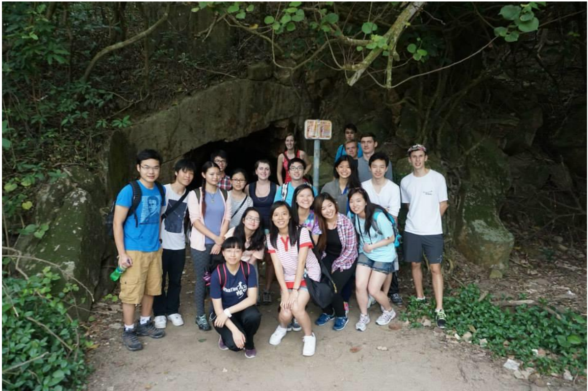
新亞書院舉辦至南丫島 Lamma Island 健行活動