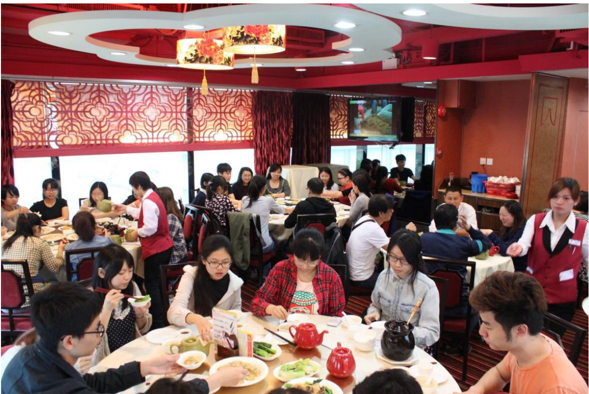
粵語課的戶外教學—「行街廣東話」至茶樓飲、食點心