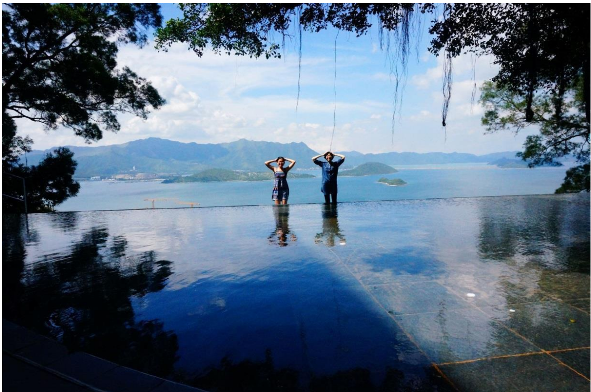
位於新亞書院學思樓旁的公共藝術「天人合一」