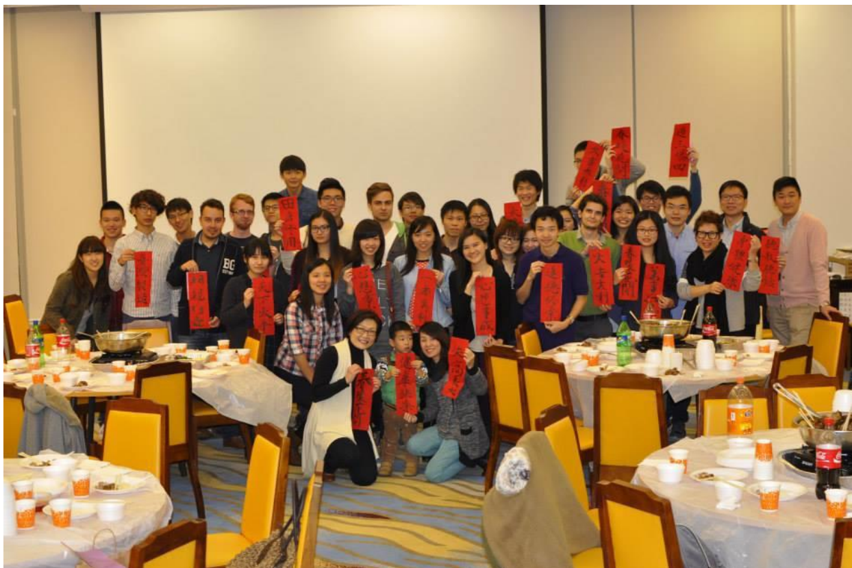
新亞書院舉辦的過年圍爐、寫春聯活動