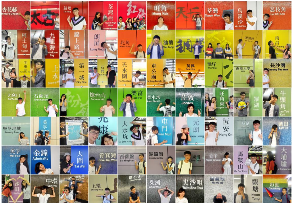
和大家一起征服港鐵站