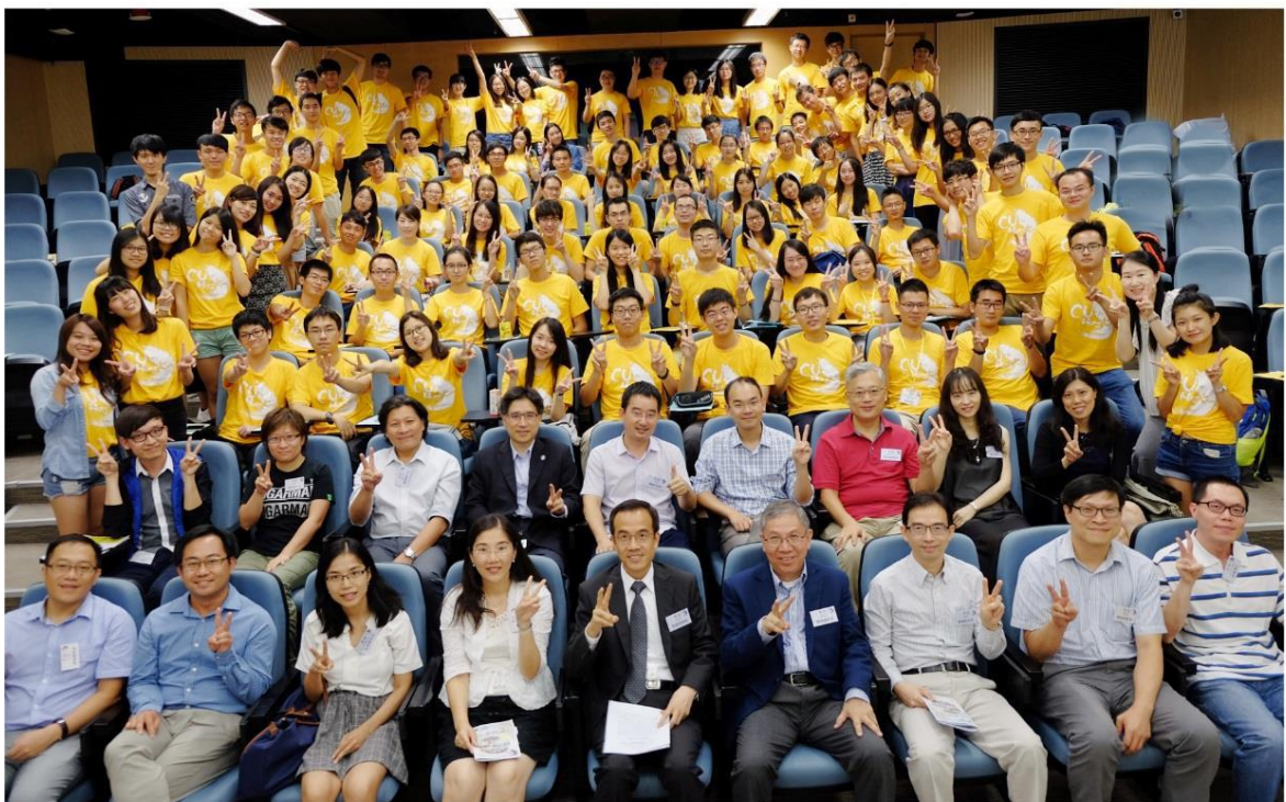
香港中文大學 學術交流處 (國內事務) 內地及台灣學生暑期研究體驗計劃 閉幕典禮 - 16.8.2016