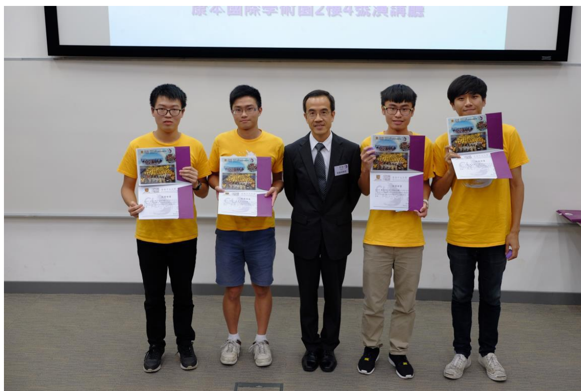
閉幕典禮副校長頒發證書 (2016.8.17 2016.8.17)