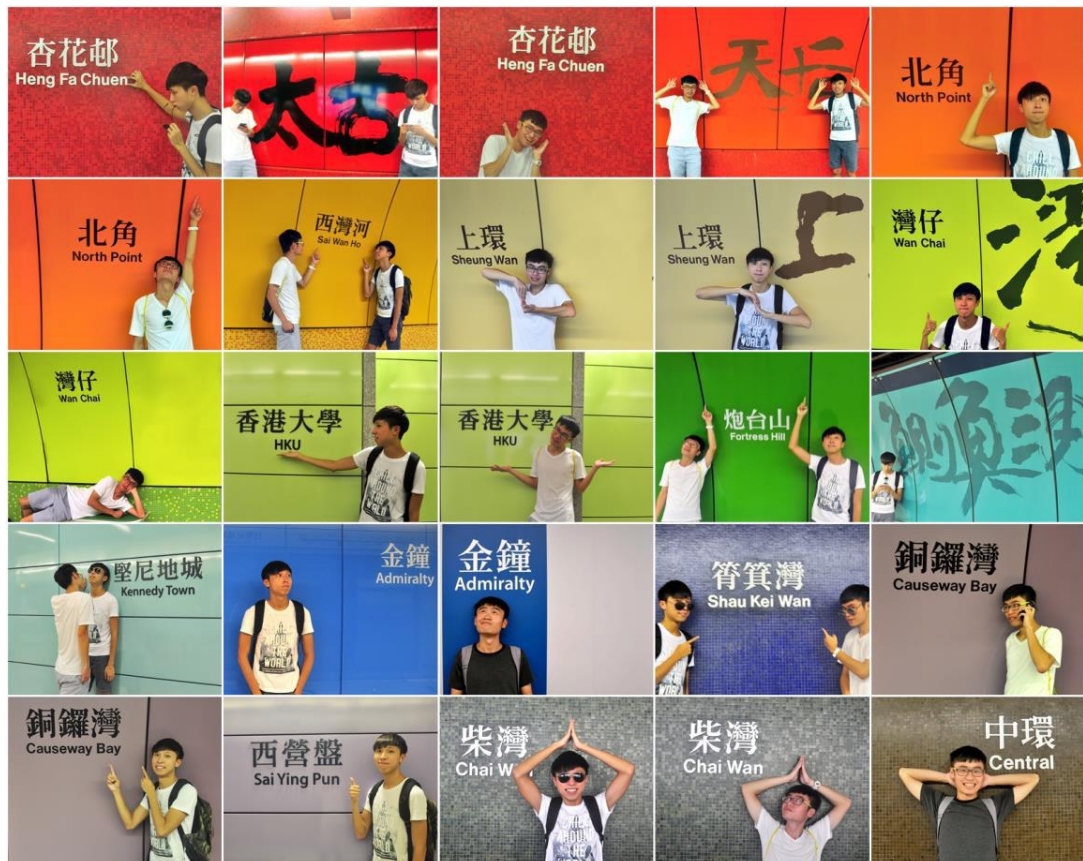
The Best Friend in HK