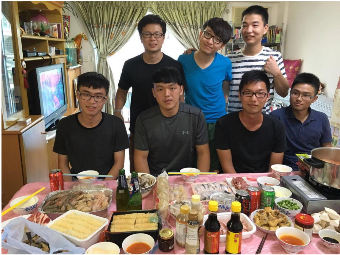
主任家一起煮火鍋