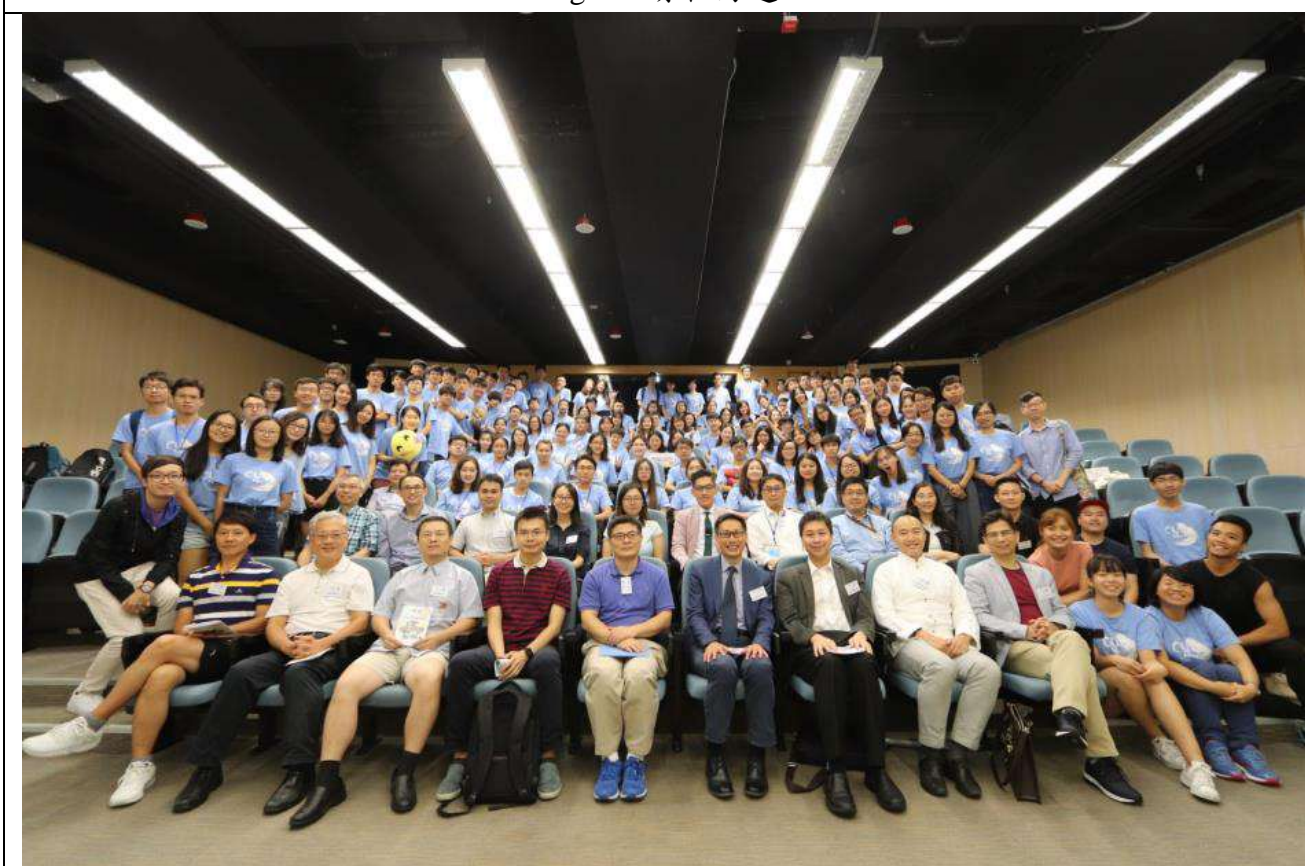
Figure 7 閉幕典禮