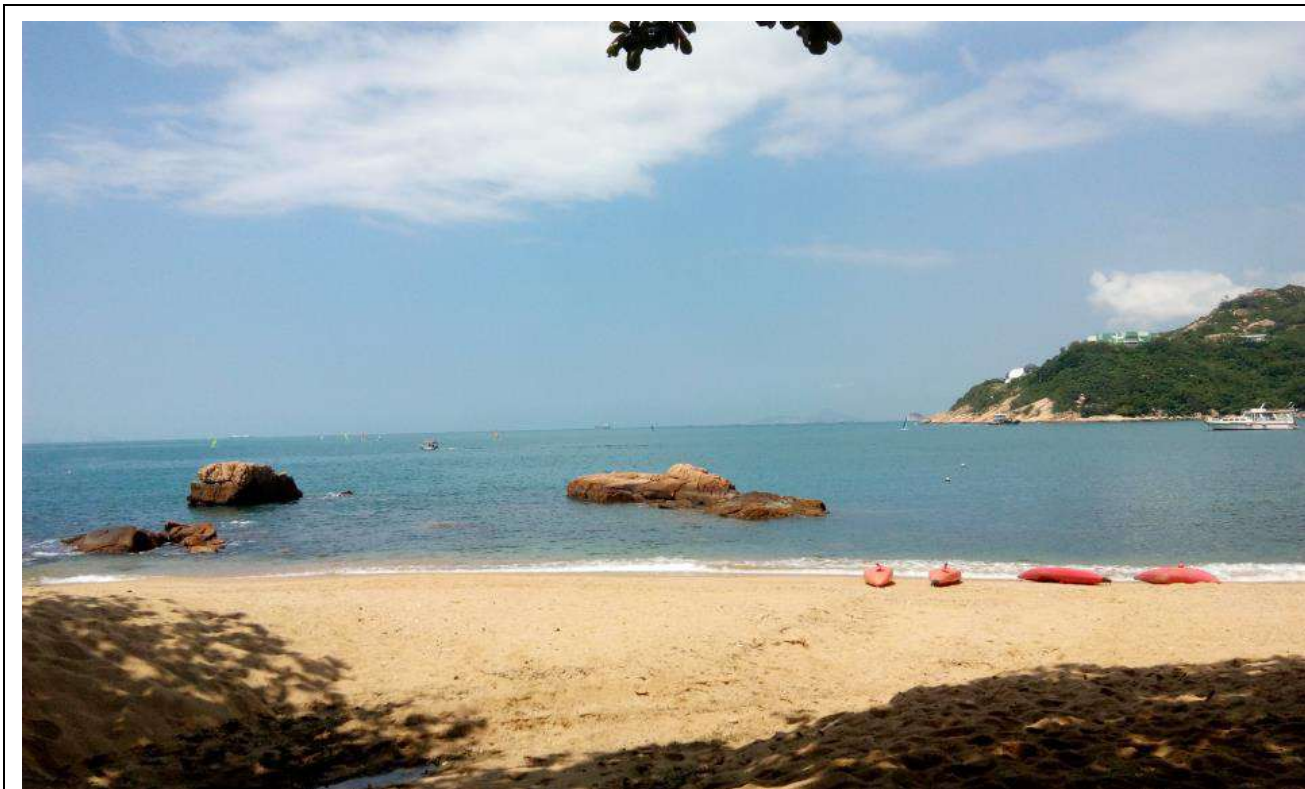
Figure 6 赤柱海邊