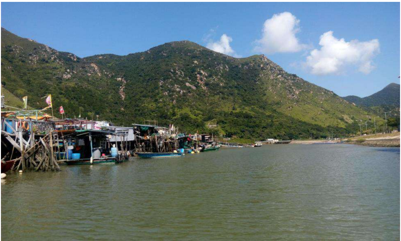
Figure 5 大澳