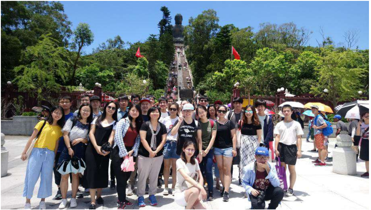
Figure 4 大嶼山