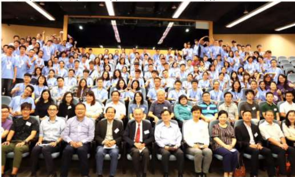
香港中文大學 學術交流處 (國內事務) 內地及台灣學生暑期研究體驗計劃 開幕典禮 - 2018.7.3