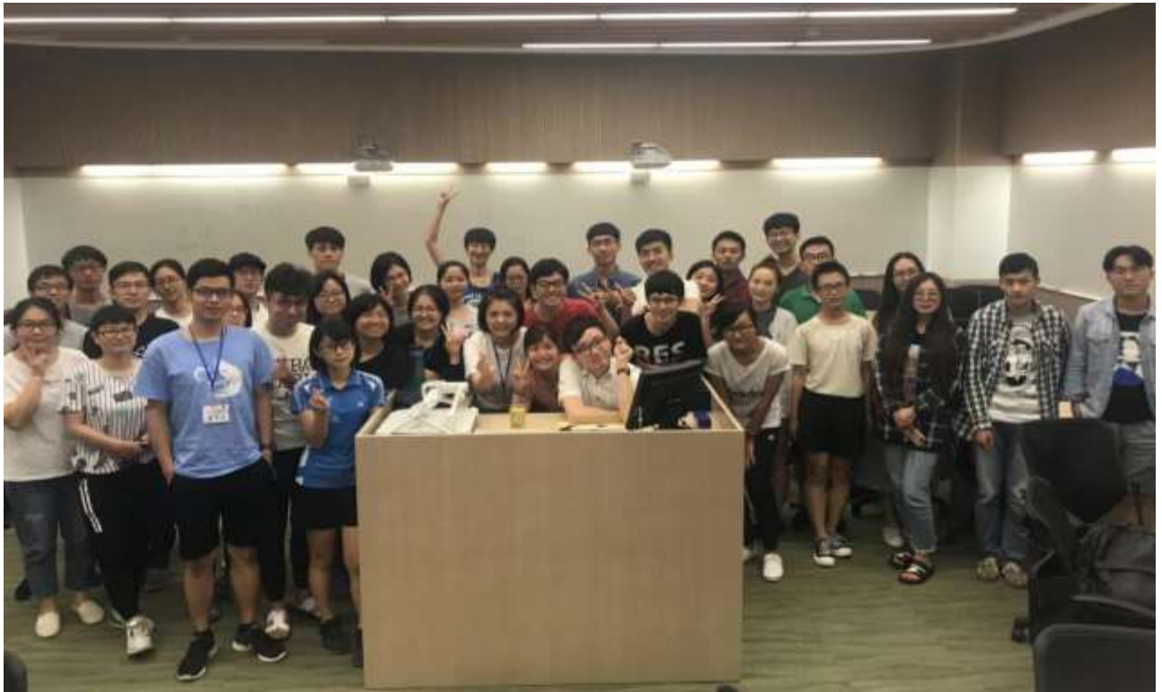
Figure 2 妙趣廣東話