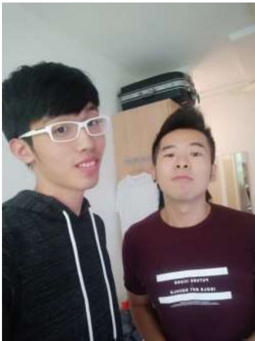
把我當弟弟照顧的德國室友