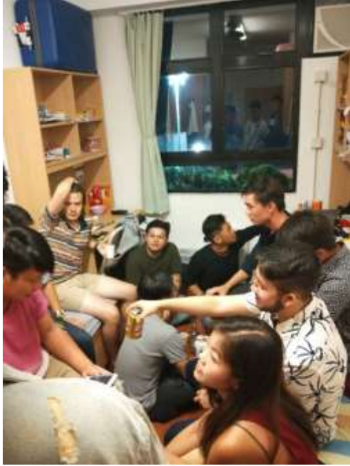
結交的許多外籍朋友