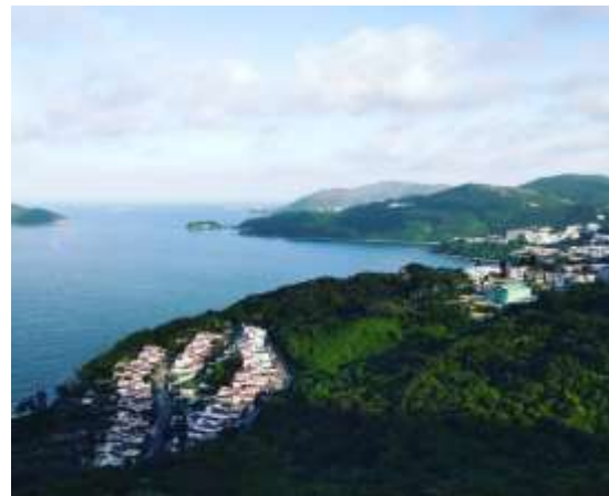
香港科技大學校園風光