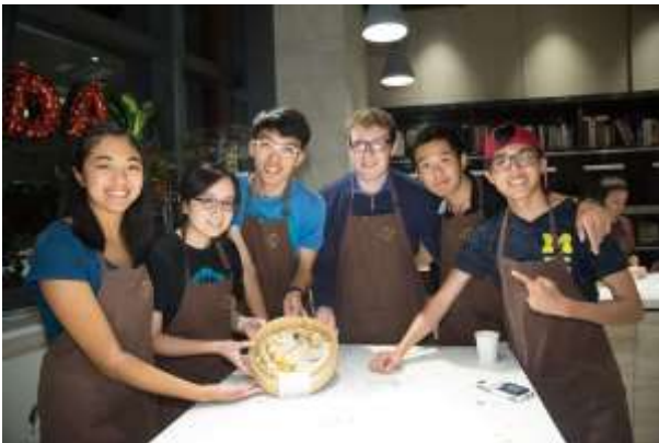
香港科技大學準備的 workshop 活動