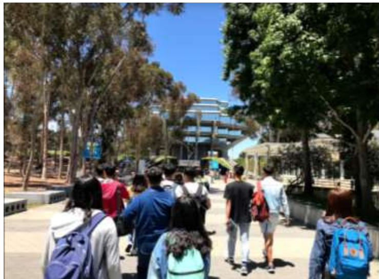
和 exchange program 中的學生一起參觀校園