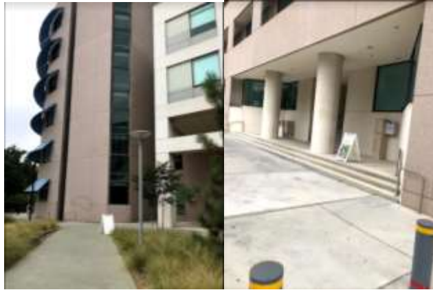
Pacific Hall ( 我的實驗室大樓 )