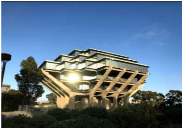
UCSD 的 Geisel Library