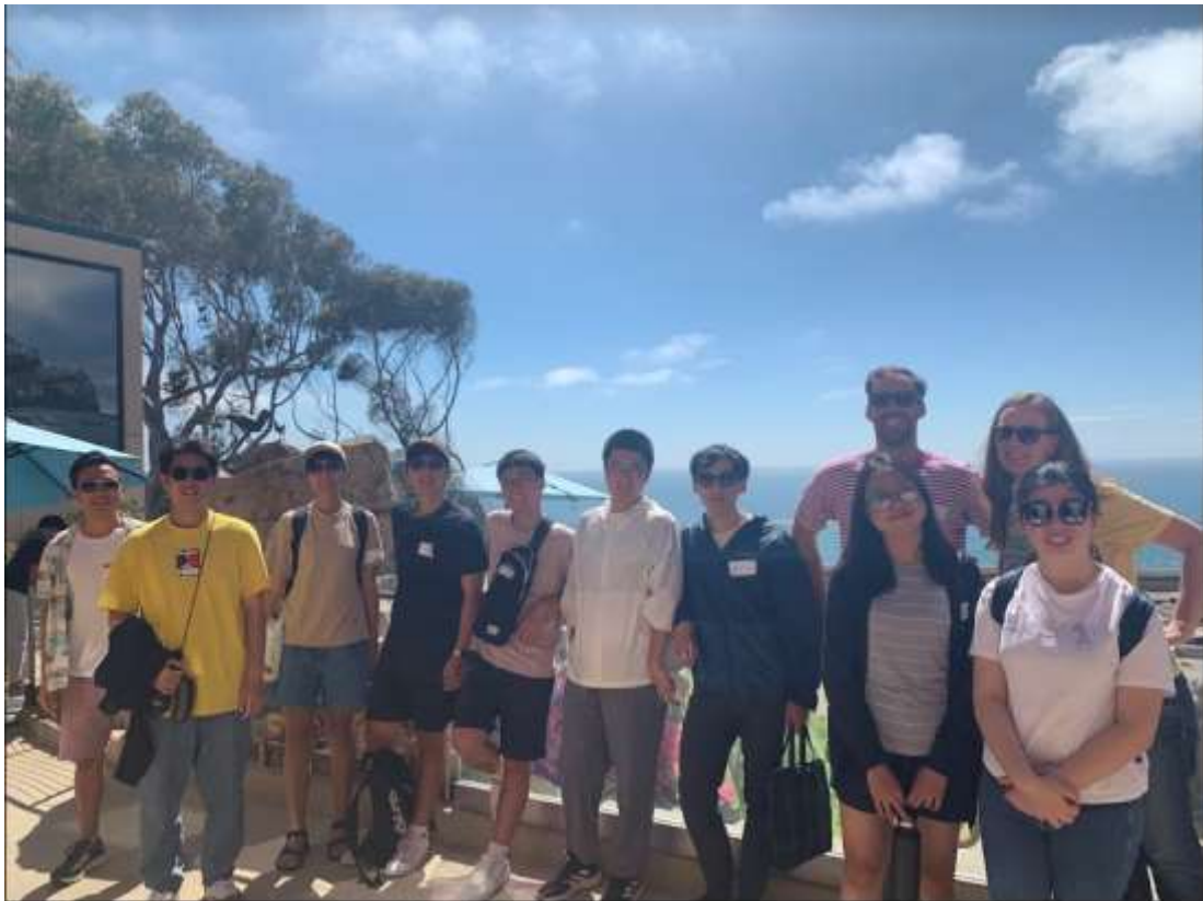
ISRP Group Photo at Scripps Institution of Oceanography