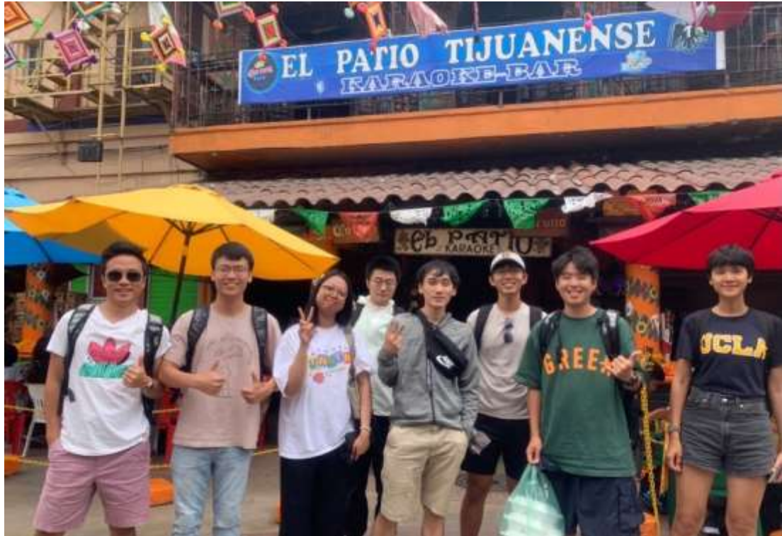
A short term (2 hour) visit to Mexico, Tijuana