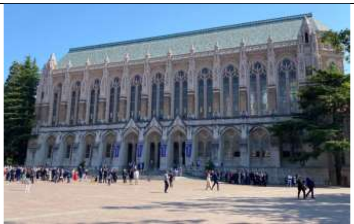
Library of UW