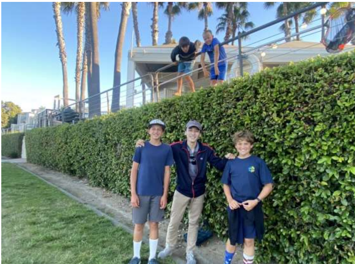
Five Adorable Kids we met at Coronado Island on the Independence Day