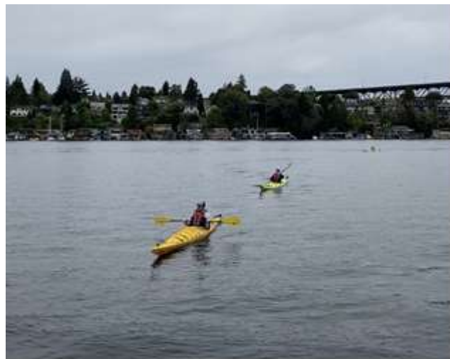
University of Washington, Portage Bay Reach