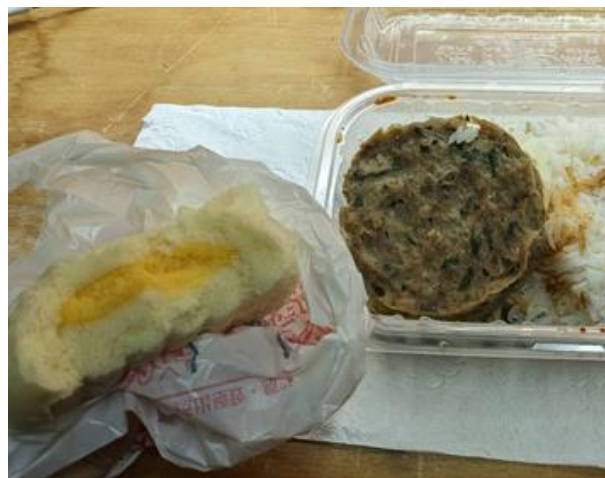
校門口唐記包點的奶皇包奶香濃郁超好吃，剛開學時每幾天會去買一次