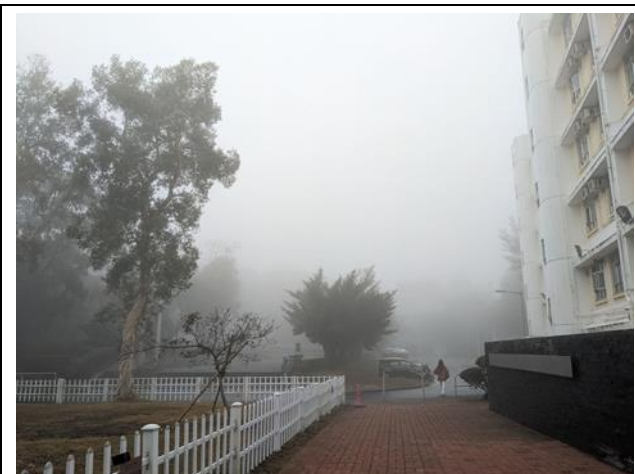
春季時整個校園都壟罩在霧裡，濕氣很重