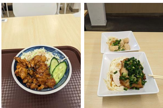
新亞書院學餐，炸雞好吃