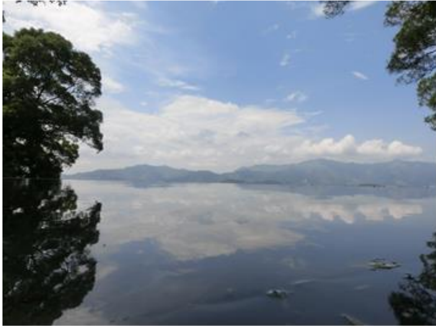
假日去找在港中大的朋友，這是港中大著名景點之一「天人合一湖」。