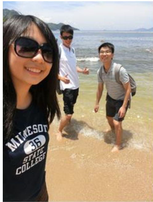
假日跟同樣來自台灣的朋友去南丫島玩!