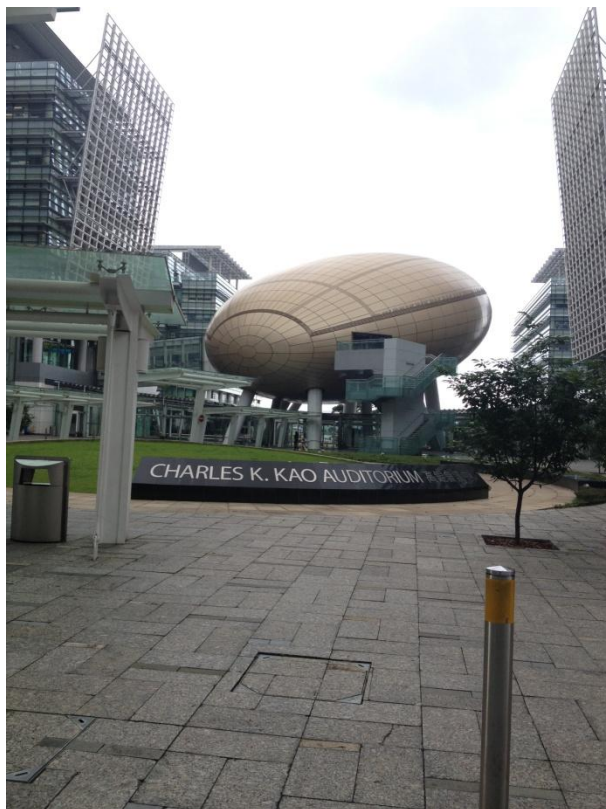
Hong Kong science park

而參訪城市大學後，覺得他們在許多公共空間都設有很多公用桌椅跟插頭，除了圖書館自習室等安靜的空間之外，也有很多地方供學生在課餘時間有地方可以討論學業、報告等等，挺不錯的，也是中大比較缺少的，可以參考看看。