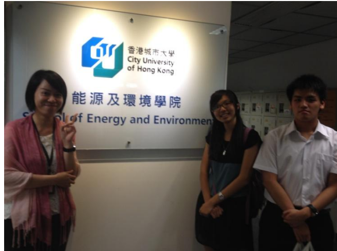
系辦小姐和研習生的合影