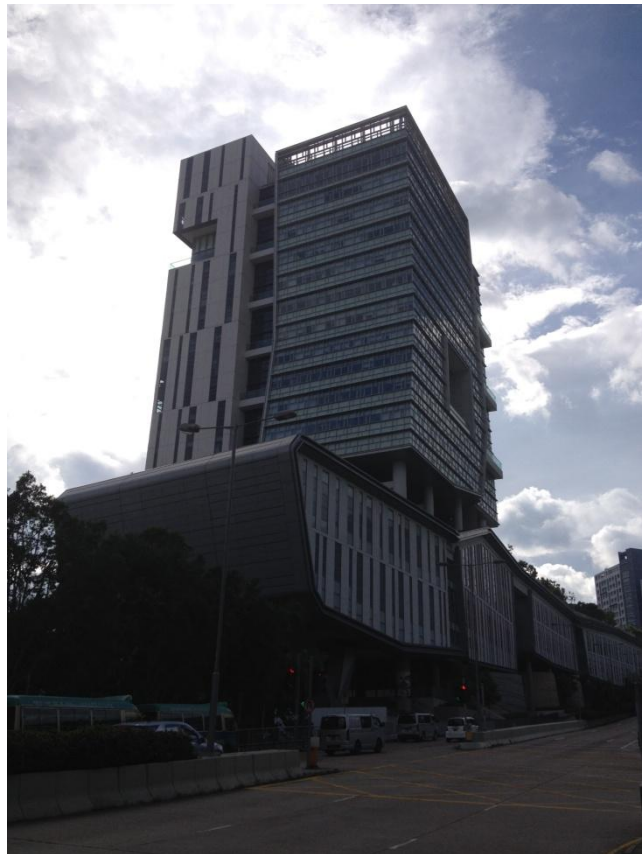
Academic 3 of City University of Hong Kong