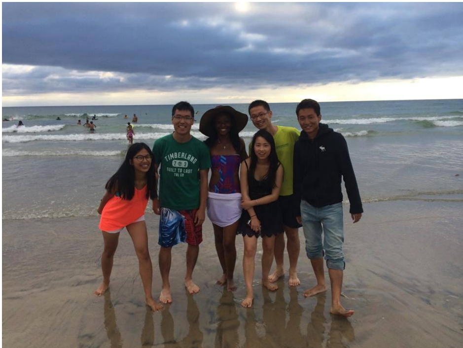
假日在學校旁的沙灘上和認識的朋友玩水還有營火晚會